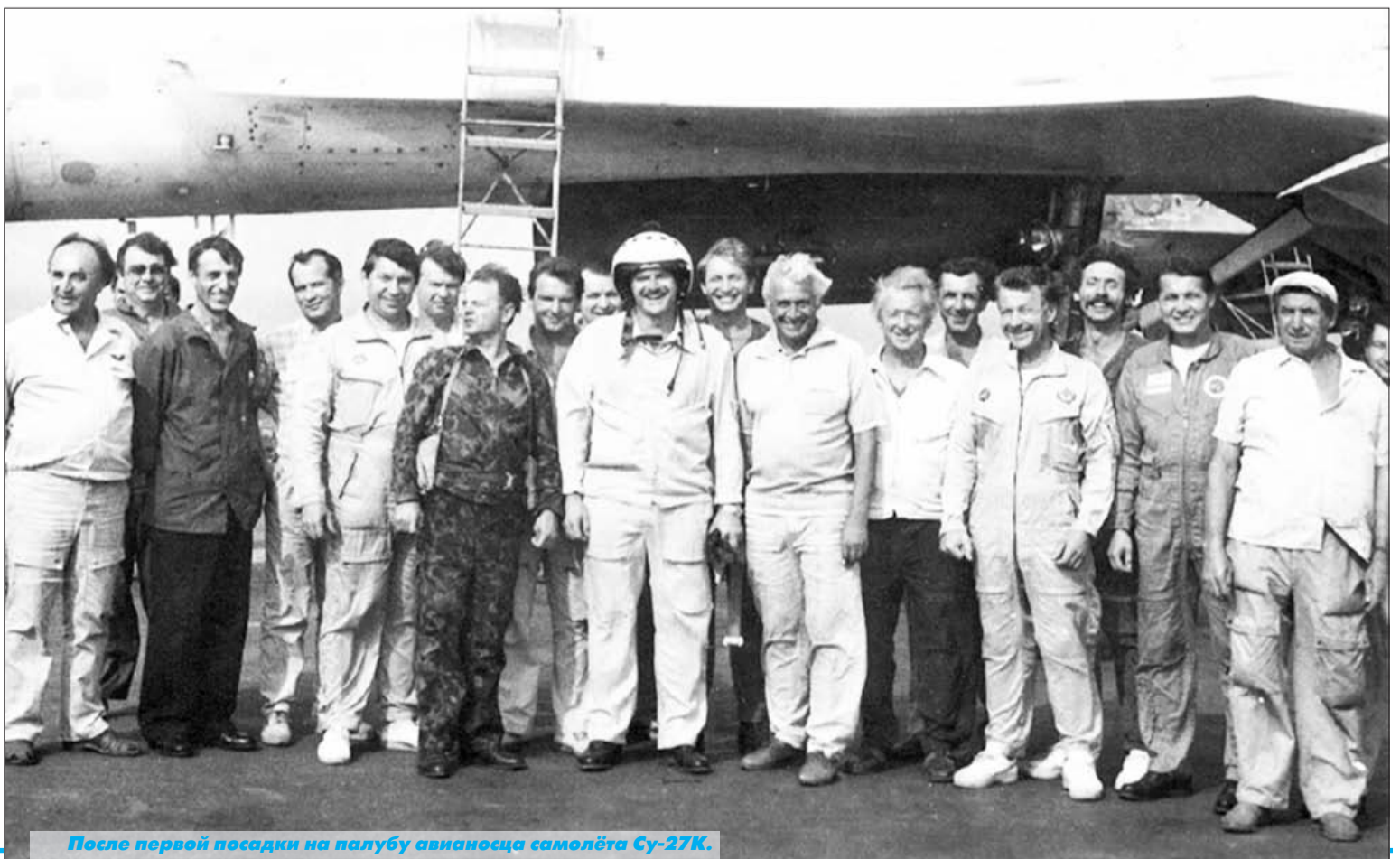
После первой посадки на палубу авианосца самолёта Су-27К.

следования. Главным направлением деятельности лётно-испытательной эскадрильи, в которую попал Россошанский, к тому времени было ис-